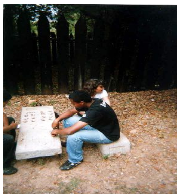
Exemple de jeu en pierre situé à Ambohymanga